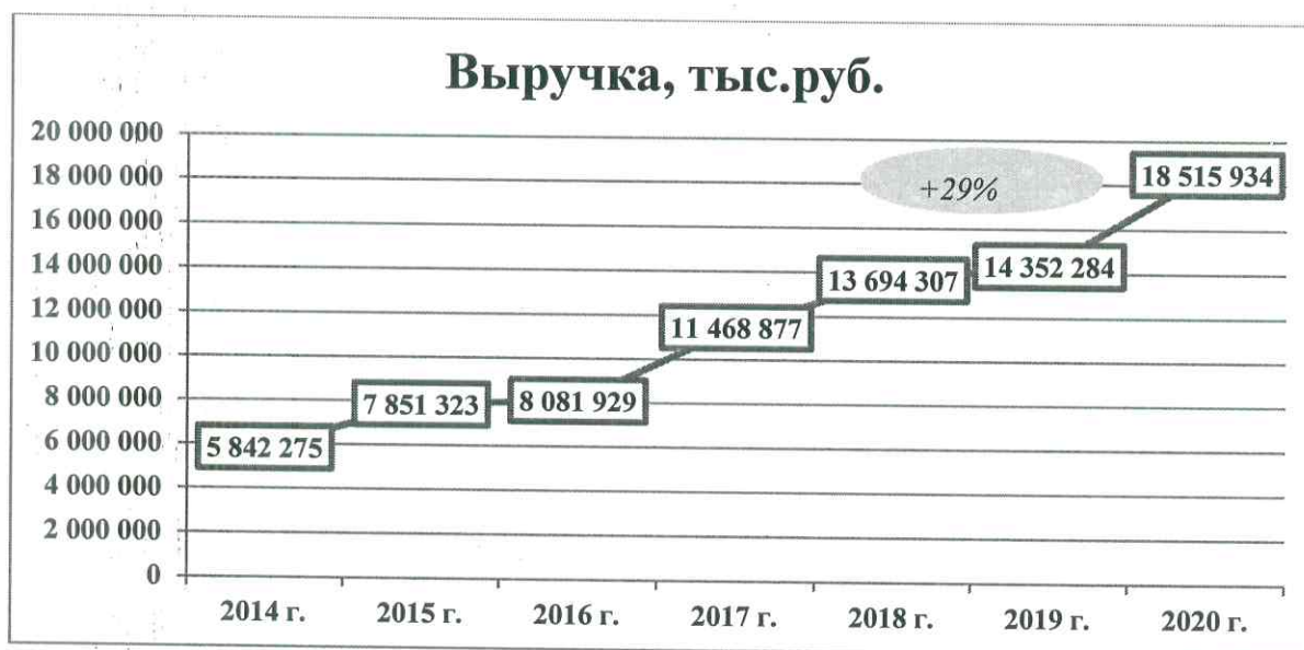
Рис. 2. Динамика выручки, тыс. руб.

Чистая прибыль за 2020 г. по предприятию составила 3 531 144 тыс. руб.