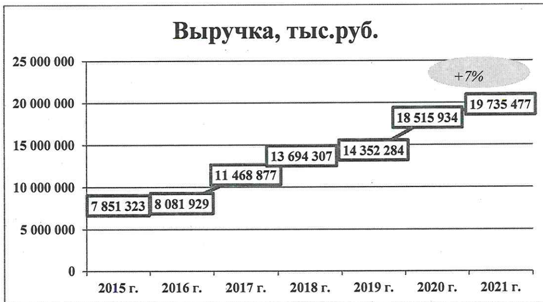
Рис. 2. Динамика выручки, тыс. руб.

В 2021 г. общество продолжило увеличение вложения средств в осуществление своей деятельности, об этом свидетельствует рост показателя валюты баланса.