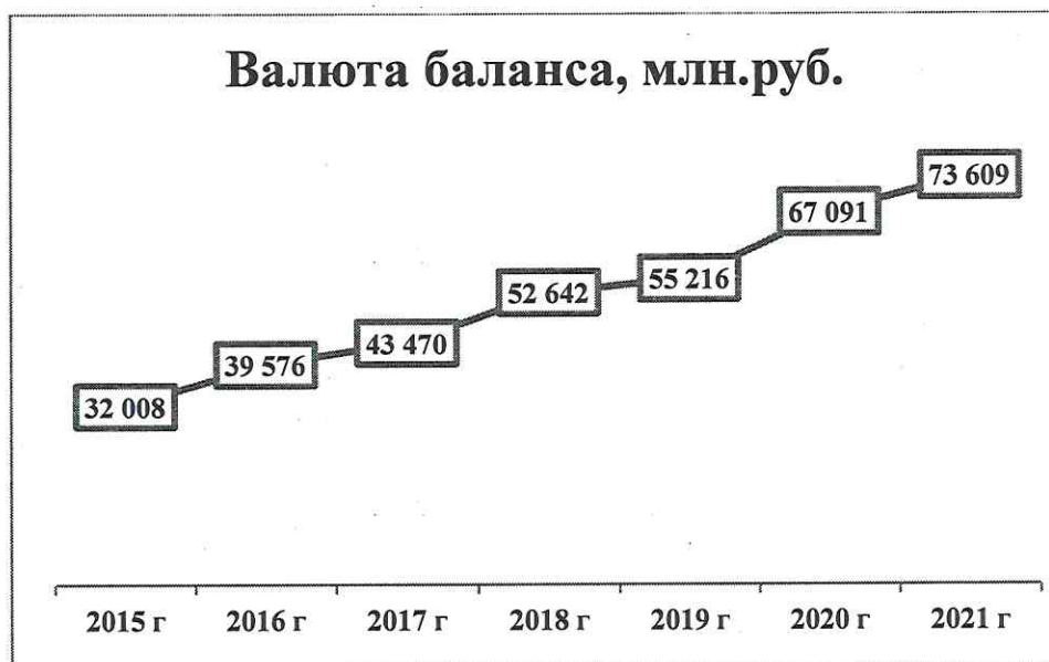
Рис. 1. Динамика валюты баланса, млн. руб.

В 2021 г. общество продолжило увеличение вложения средств в осуществление своей деятельности, об этом свидетельствует рост показателя валюты баланса.