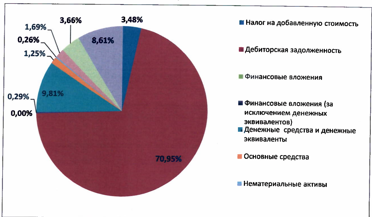
Рисунок 1 Структура активов ООО "АВП РУС", 2021

Структура активов Общества в разрезе основных групп представлена ниже на диаграмме: