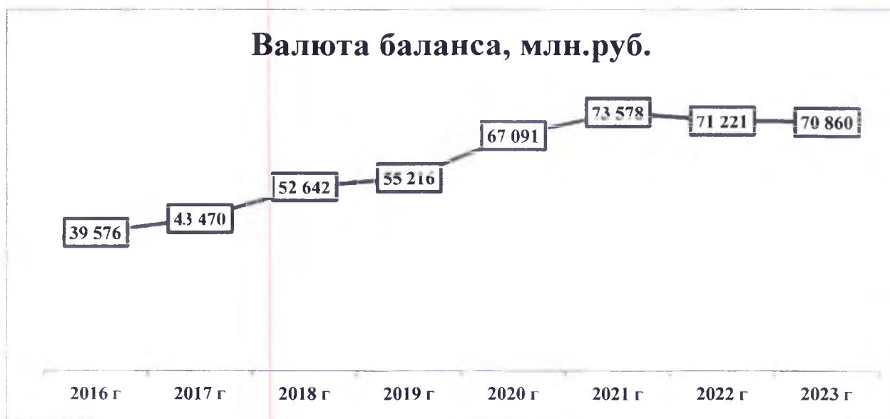
Рис. 1. Динамика валюты баланса, млн. руб.

Валюта баланса в конце отчетного периода снизилась по сравнению с началом периода.